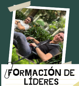
FORMACIÓN DE LÍDERES JUVENILES